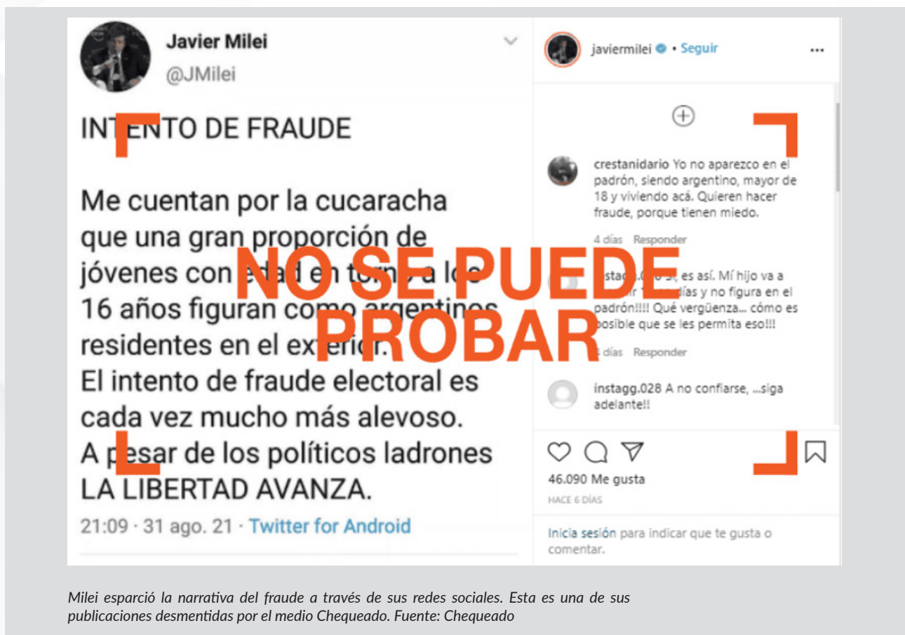
Milei esparció la narrativa del fraude a través de sus redes sociales. Esta es una de sus publicaciones desmentidas por el medio Chequeado.

Uno de los ejemplos más recientes de este fenómeno lo vimos en la última elección presidencial en Argentina. En primera vuelta, los dos candidatos que obtuvieron mayor votación fueron Sergio Massa, de la coalición peronista Unión por la Patria, con el 36,68%; y Javier Milei, del partido ultraderechista La Libertad Avanza, con 29,98%. La noche en que se anunciaron los resultados, Milei dio un discurso en el que aseveró que hubo 5 mil denuncias de fraude. Esto era falso. La Cámara Nacional Electoral (CNE) solo registró 105 denuncias ciudadanas ese día, una cifra similar a otras elecciones.