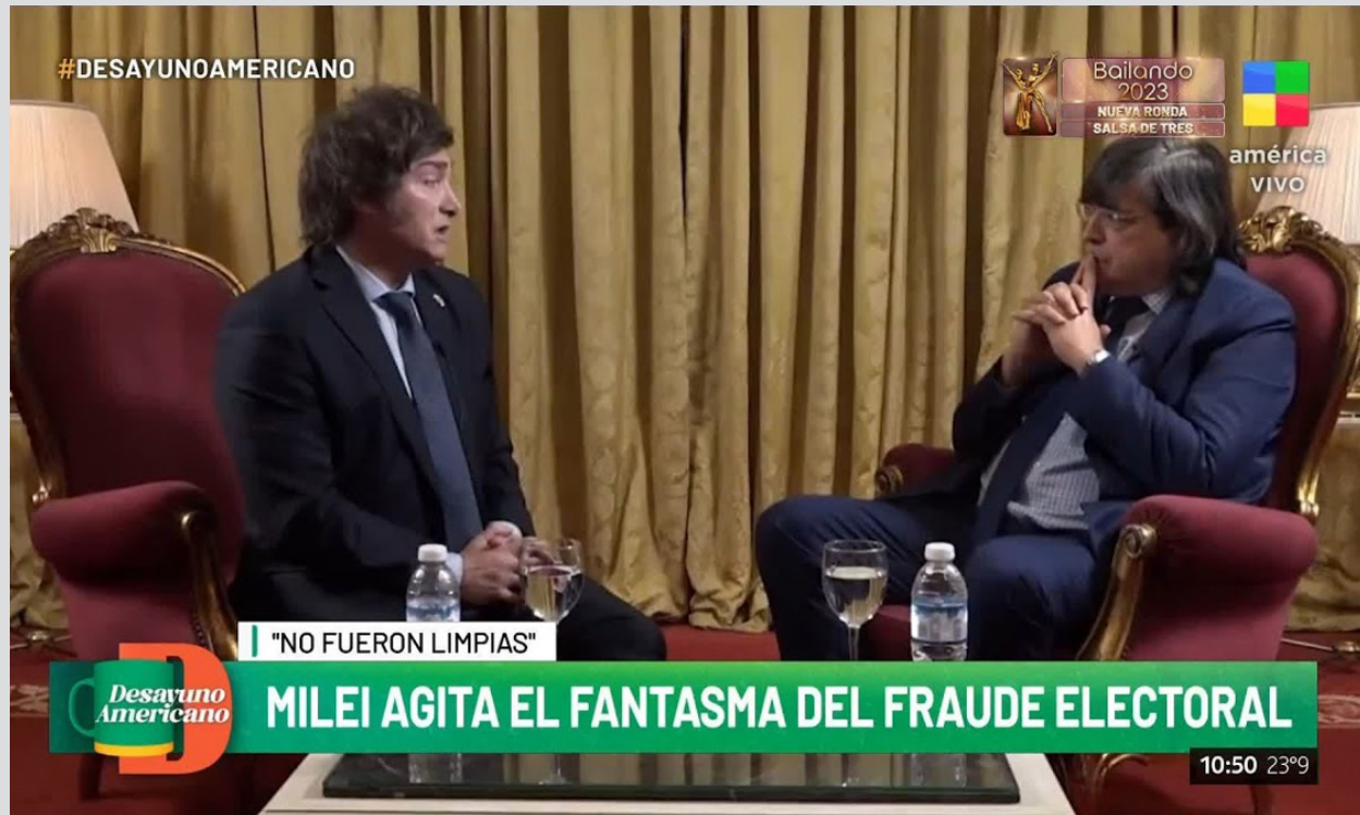
Milei esparció la narrativa del fraude en varias entrevistas televisivas.

A solo tres días de la segunda vuelta, su partido, La Libertad Avanza, denunció ante la justicia que la policía militar (la 'Gendarmería') había gestado un "fraude colosal" en favor de su oponente, Sergio Massa. La policía militar son los encargados de custodiar las urnas y las papeletas en el proceso electoral, por lo que se les acusaba de cambiar el contenido de las urnas y la documentación para beneficiar a Massa.