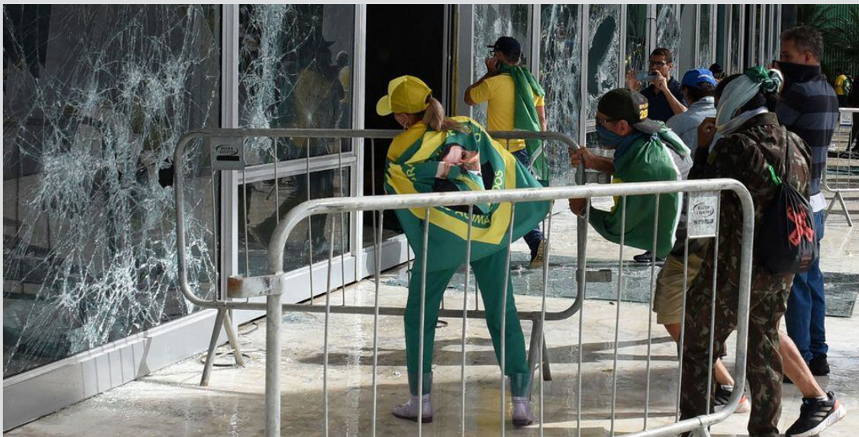
Seguidores de Bolsonaro causan destrozos luego de saber los resultados en el Tribunal Supremo de Brasil, en Brasilia.

En Brasil, Argentina y Colombia la desinformación giraba en torno al sistema de votación y fue difundida por el mismo candidato presidencial o por partidarios del candidato.