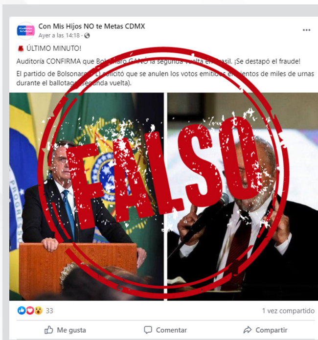
Los mensajes con desinformación se volvieron virales e incluso traspasaron fronteras. Este es un ejemplo que desmintió el medio Colombiacheck.

Durante su carrera política, y especialmente durante su mandato presidencial, Bolsonaro cuestionó en numerosas ocasiones la seguridad del sistema de votación brasileño, especialmente en su primera campaña presidencial, en 2018. En ninguna de esas oportunidades presentó evidencia y los cuestionamientos hechos fueron desmentidos.